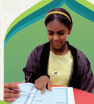
سديم الخير تأثأة وتأخر نطق