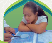
فهمدة الراجح متلازمة داون