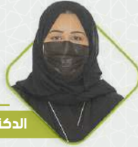
صاحبة السمو الملكي الأميرة الدكتورة / أواء بنت فهد آل سعود