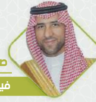
صاحب السمو الملكي الأمير فيصل بن سلطان آل سعود