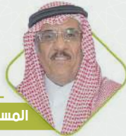
المستشار / عبدالعزيز سليمان آل حسين